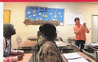
Primary Teacherとして担当した日本語の授業

高校教員経験5年を経て、1年の休職期間でFLTAの経験をしたことは、一生分の価値がありました。世界中の人と繋がることができたことはかけがえのない財産です。