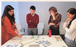
デザイン会社でのインターン風景

フルブライト奨学金はインターネット検索で知りました。退職し、家族を連れて留学するには、奨学金なしでは金銭的に厳しい状態でした。フルブライト奨学金は学費と生活費が手厚いという魅力に加え、フルブライターのネットワークが強いと知り、その仲間に入ってみようというのが大きなモチベーションになりました。