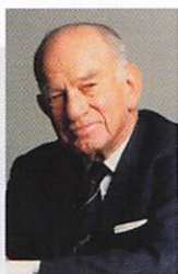
J.ウィリアム・フルブライト上院議員

同窓生として専門性の高い職業あるいは私的な活動を通して、直接的・間接的に日米関係の向上に貢献すること